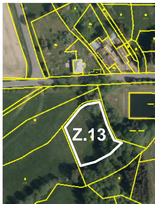
Výstřižek z připravovaného hlavního výkresu a letecký snímek.