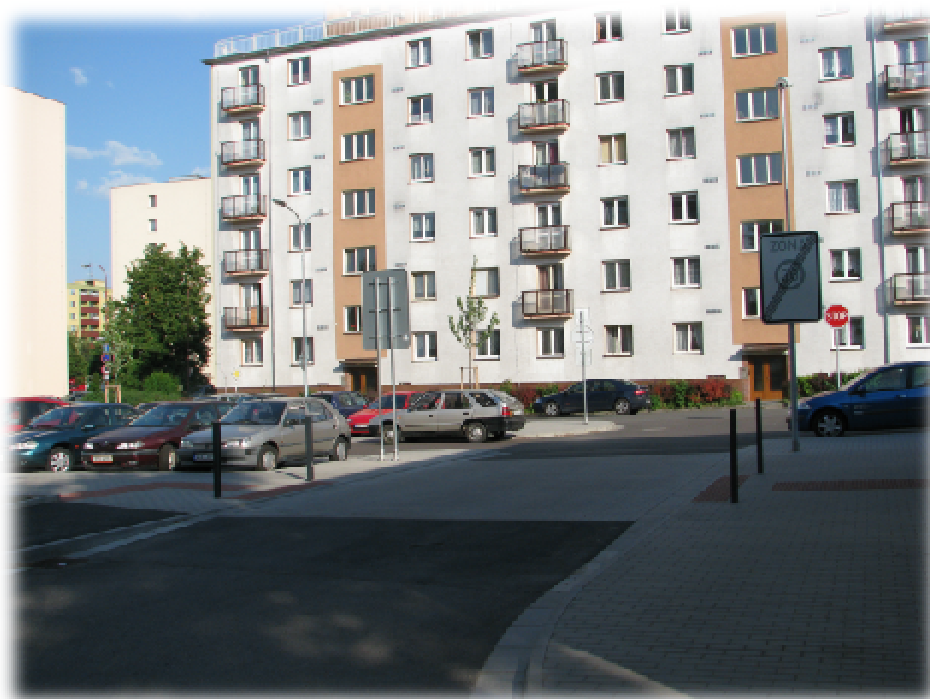
Foto číslo 10 – dopravní řešení v lokalitě, které po rekonstrukci vymezuje větší prostor pro pěší

Problematika mobility a dopravy je řešena v rámci širších vztahů. V zóně jsou budovány parkoviště i jednotlivá parkovací stání. Dopravní obslužnost je zajištěna prostřednictvím pravidelných linek HMD. Nově vzniklá obytná zóna napomůže zklidnění a bezpečnost provozu a zároveň bude vytvořen lepší prostor pro pohyb pěších.