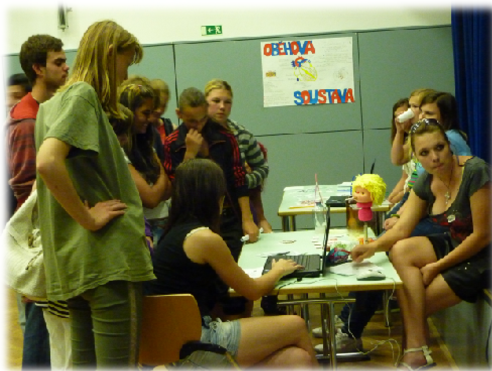
Foto číslo 8 – akce jednoho z partnerů přímo v dané lokalitě zaměřená na prevenci kouření

Programy zaměřené na zdravé stravování, prevenci kouření a konzumace drog a alkoholu je zajištěn prostřednictvím jednoho z partnerů. Ten ve spolupráci s městem Chrudim připravuje pravidelné osvětové programy, kde je veřejnost informována o rizicích, negativních vlivech, ale i možnostech poradenství. Akce probíhají přímo v dané lokalitě. Jsou připravovány pro všechny cílové skupiny obyvatel.