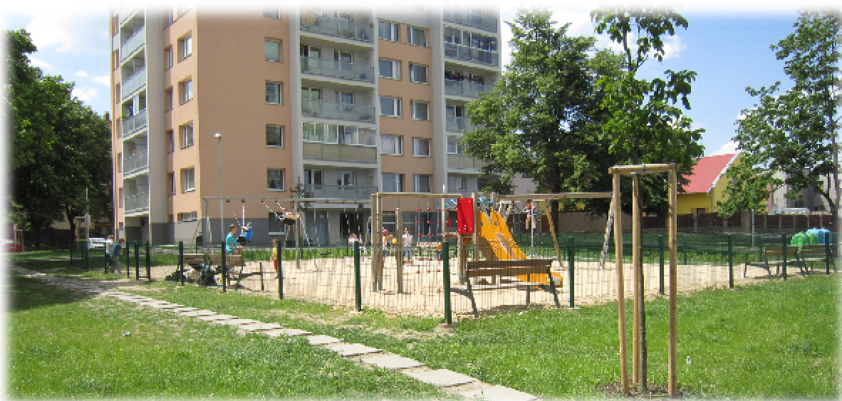
Foto číslo 4 – rekonstruované dětské hřiště s nově vysazenými stromy

Dalším revitalizovaným územím je uzavřený vnitroblok Revoluční . Navržené řešení revitalizace neudržovaných ploch uvnitř vychází z historické tradice. Rozdělení vnitřních prostor obytného bloku mezi jednotlivé domy, podobně jako tomu bylo v době výstavby, kdy k jednotlivým domům patřil polosoukromý venkovní prostor za domem, je doplněno prostorem veřejným, společným pro celý blok. Jednotlivé domovní dvory jsou přidanou hodnotou k domu vlastnímu. Od okolí jsou odděleny živým plotem, případně v omezené míře opravenou zdí. Takto vytvořená hierarchizace prostorů dovoluje jednotlivým nájemníkům bydlících v bytech využít venkovního prostoru k relaxaci s pocitem vlastního soukromí.