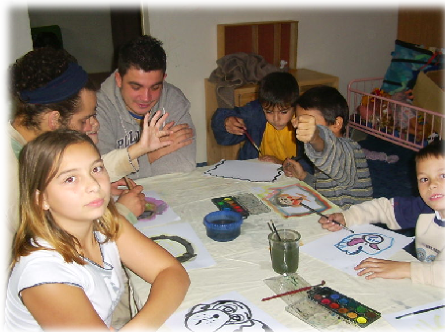
Foto číslo 9 – přímo v lokalitě poskytuje nezisková organizace sociální práci dětem i jejich rodinám

Problematika mobility a dopravy je řešena v rámci širších vztahů. V zóně jsou budovány parkoviště i jednotlivá parkovací stání. Dopravní obslužnost je zajištěna prostřednictvím pravidelných linek HMD. Nově vzniklá obytná zóna napomůže zklidnění a bezpečnost provozu a zároveň bude vytvořen lepší prostor pro pohyb pěších.