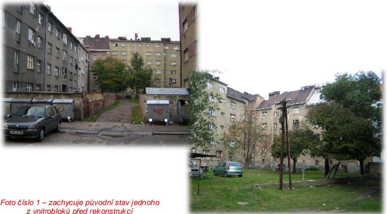
Foto číslo 1 – zachycuje původní stav jednoho z vnitrobloků před rekonstrukcí