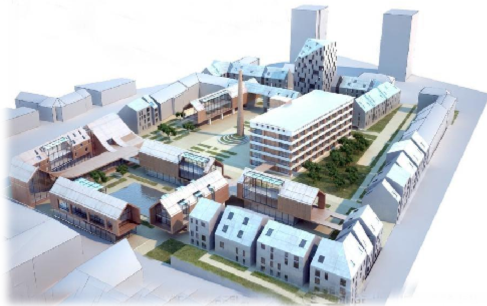
Vizualizace návrhu revitalizace areálu Evony zhotovený studenty

V zóně se nachází firma, která má dlouholetou tradici a zaměřuje se na výrobu punčoch a prádla. Bohužel do budoucna nebude možné využít celý areál jen pro výrobu daného zboží. Je proto uvažováno s proměnou areálu v moderní víceúčelový komplex. S touto myšlenkou pracovali studenti stavební fakulty ČVUT. Ve svých návrzích zohlednili důležitost tohoto území a také historicko - urbánní vztah k městu.