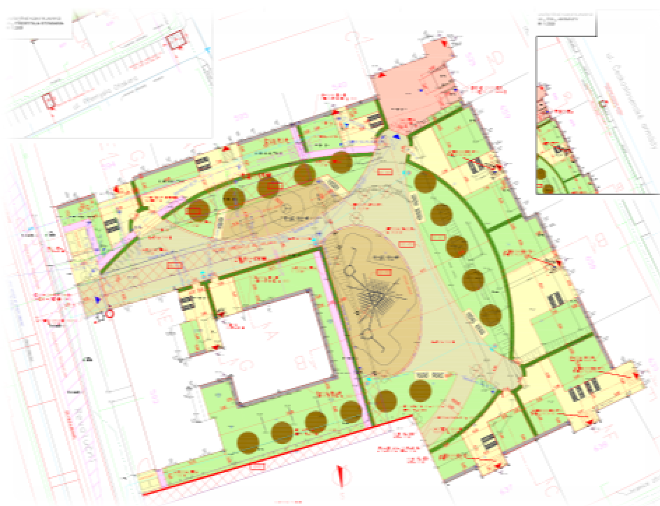
Projektová dokumentace rekonstrukce vnitrobloku Revoluční

Společný veřejný prostor, který leží za hranicí domovních dvorů, tvoří sportovně rekreační zázemí bloku domů a nejbližšího okolí.