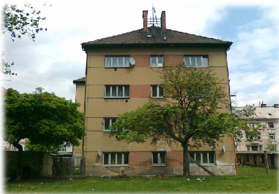
Foto číslo 5 – jeden z domů ve vlastnictví města, kde žili nepřizpůsobiví občané, před rekonstrukcí

Sanací základů a hydroizolací spodní stavby došlo k zamezení vztlínající vlhkosti vážně narušující bytové domy.