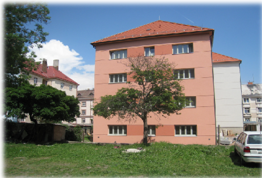
Foto číslo 6 – pohled na bytový dům ve vlastnictví města, kde žili nepřizpůsobiví občané, po rekonstrukci