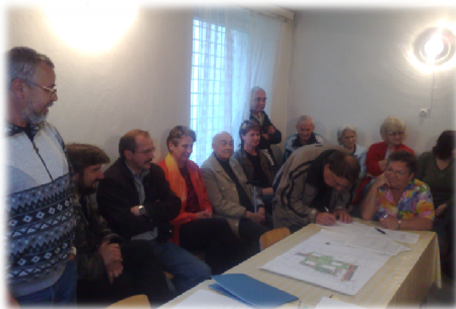
Foto číslo 7 – projednání záměru revitalizace bytového domu s jeho vlastníky

Velkým partnerem jsou i vlastníci bytových domů. Partneři svou znalostí existujících problémů v deprimované zóně přispívají svými návrhy dílčích aktivit ke komplexnímu zlepšení prostředí a poukazují tak na možná rizika plynoucí z jejich realizace.