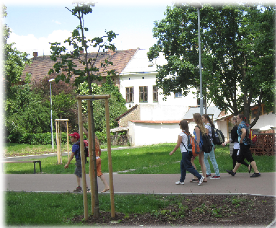
Foto číslo 2 – zachycuje rekonstruovanou průchozí spojnici mezi vnitrobloky

Nově vzniklá místa k sezení zde poskytují variantní nabídku typu a míst k odpočinku ve všech částech území. Jedním typem jsou tzv. „společenské lavice“ řešené formou pevných dlouhých laviček vybízejících k setkávání a odpočinku větších skupin uživatelů a jsou osvědčeny např. u mladých lidí. Dobře fungují i pro jednotlivce či menší skupiny. Jejich rozmístění je spojeno s kapacitnějšími pěšími trasami a nejdůležitějšími prostory, jako například navrhovanou hlavní pěší spojnici. Standardní a komfortnější sezení nabízejí mobilní lavičky, jejichž rozmístění je vázáno především na zelen (stromy), klidové partie bloku, dětské hřiště a vstupy do věžových objektů.