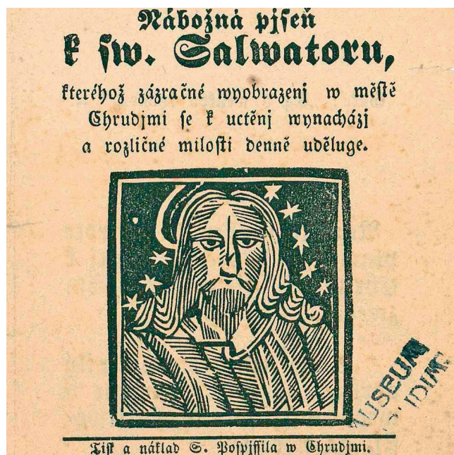
Nábožná píseň k sv. Salvatoru, kteréhož zázračné vyobrazení v městě Chrudimi se k uctění vynachází a rozličné milosti denně uděluje

Jana Beranová, Regionální muzeum v Chrudimi