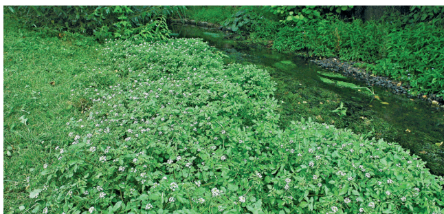
Potočnice lékařská se v náhonu v Koželužské ulici poprvé objevila v roce 2007

Bohužel se do nového seznamu invazních druhů nedostaly křídlatky. Odkud pocházejí křídlatka japonská a křídlatka sachalinská, dobře vypovídají jejich druhová jména. Do Evropy byly přivezeny jako okrasné rostliny. Jedná se o druhy, které se šíří především vegetativně rozrůstáním podzemních oddenků, a tak není divu,