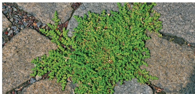
Průtrzník lysý vyrůstající mezi dlažbou

Příchodem člověka, a především vznikem trvalého osídlení, začala být původní květena obohacována o nové druhy, a to jak o záměrně dovezené, tak mnohem častěji o ty, které byly zavlečeny náhodně. Druhy doprovázející člověka označujeme jako synantropní. Způsob, jakými se synantropní druhy dostaly na území dnešní Chrudimě, jsou různé, stejně jako doba, ve které přišly, a způsob jejich zdomácnění. Pro třídění zavlečených druhů se nejčastěji používá rozdělení