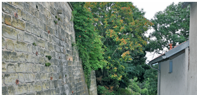
Pajasan v ulici Na Kopanici