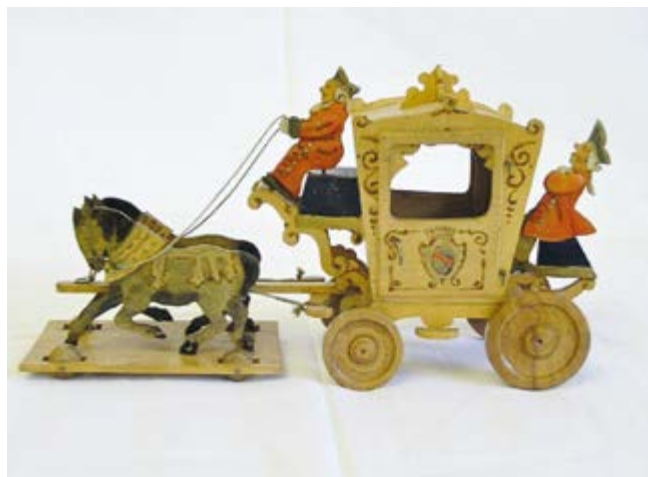
Rokokový dřevěný kočár – Hořické hračkářské družstvo, 1910